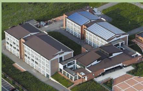
Impianto fotovoltaico kWp 77,28